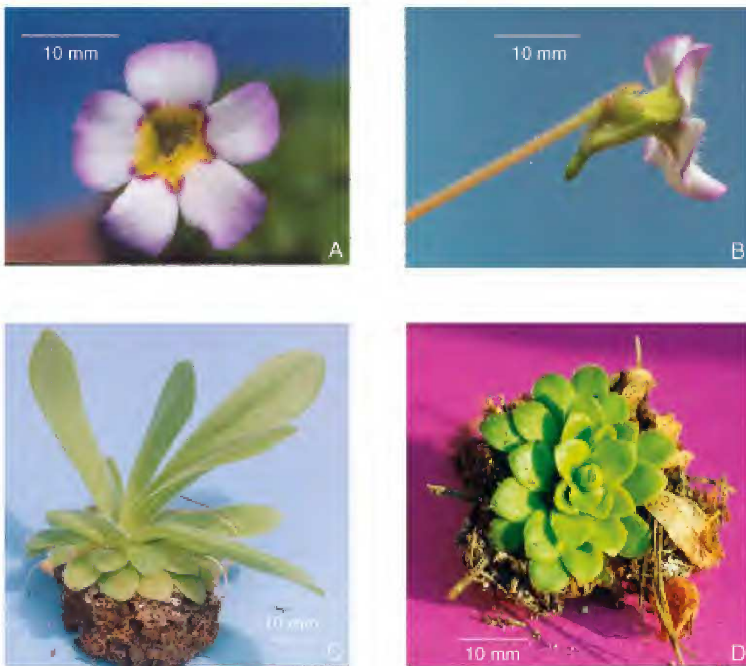
Fig. 5. Pinguicula martinezii Zamudio. A. Flor muy colorida vista de frente; B. Flor vista de lado; C. Planta con hojas de “verano” jóvenes surgiendo del centro de la roseta de “invierno”; D. Planta con hojas de “invierno”.

púrpura, cubiertos densamente con glándulas estipitadas de 0.5 a 1 mm de largo, unifloros; flores de 13 a 25(30) mm de largo (incluyendo el espolón); cáliz bilabiado, verde, cubierto con glándulas estipitadas en ambas caras; labio superior trilobado, dividido hasta 1/2 o 2/3 de su longitud, lóbulos triangulares a oblongos, de 2 a 4 mm de largo, 2 a 2.7 mm de ancho; labio inferior bilobado, dividido hasta 1/2 o 2/3 de su longitud, lóbulos triangulares a elípticos, de 1.5 a 2.5 mm de largo, 1.5 a 2 mm de ancho; corola subisoloba, el labio inferior un poco más grande que el superior, variando de color de completamente blanca a blanca con el margen de los lóbulos violáceo y con manchas de color violeta en la base de los lóbulos que rodean la garganta, cubierta con glándulas estipitadas cortas en la cara externa y con largos